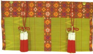
新倭錦(しんやまとにしき)