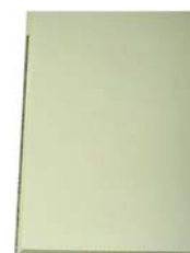
教会用 字入 教会用 無地