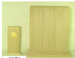
桐製 桐製 教会用