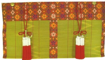
新倭錦(しんやまとにしき)